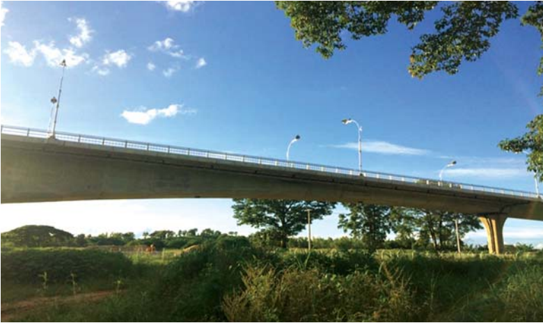
พื้นที่บริเวณที่สร้างสะพานมิตรภาพไทย-เมียนมา แห่งที่ 2 อำเภอแม่สอด จังหวัดตาก