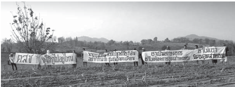
การเคลื่อนไหวของกลุ่มคนแม่สอดรักถิ่น

เคลื่อนไหวเรียกร้องให้มีกรแก้ไขปัญหของพวกเขา อาทิ การตั้งกลุ่ม โนนนาม กลุ่มคนแม่สอดรักถิ่น เพื่อเป็นตัวแทนในการเจรจากับหน่วยงาน ภาครัฐที่เกี่ยวข้อง นอกจากนี้ ชาวบ้านที่ได้รับผลกระทบ ยังไปยื่นคำร้อง คัดค้านกับสำนักงานที่ดิน จังหวัดตาก สาขาแม่สอด ด้านการออกโฉนด ให้กับกรมธนารักษ์ ซึ่งเป็นหน่วยงานที่รับผิดชอบที่ราชพัสดุ ซึ่งต่อมา เมื่อชาวบ้านส่วนใหญ่เห็นชอบกับข้อเสนอการจ่ายเงินช่วยเหลือจาก กรมธนารักษ์แล้ว ได้ไปถอนคำคัดค้าน แต่ยังคงเหลือชาวบ้านที่ได้รับ ผลกระทบอีก 6 คนที่ยังไม่ถอนคำคัดค้าน และยืนยันว่าจะต่อสู้ต่อไป จนกว่าข้อเรียกร้องของพวกเขาที่ขอให้รัฐจัดหาที่ดินใหม่ให้ในจำนวน ที่เท่าเดิมที่ชาวบ้านแต่ละคนถือครองอยู่ และให้มีการออกเอกสารสิทธิ ในที่ดินที่จัดหาให้ใหม่ด้วยนั้นจะบรรลุผล นอกจากนี้ ชาวบ้านทั้ง 6 คน ที่ยังไม่ยอมรับข้อเสนอของภาครัฐ ยังได้ดำเนินการฟ้องคดีเป็นรายบุคคล ต่อศาลปกครองพิษณุโลก ว่ากรมที่ดินออกโฉนดโดยไม่ชอบให้กับ กรมธนารักษ์ ซึ่งล่าสุด ศาลปกครองพิษณุโลก ตัดสินพิจารณาคำนำ ยบายคดี และว่าหากโจทก์ยืนยันที่จะดำเนินการต่อ ต้องไปยื่นฟ้อง ที่ศาลยุติธรรมแม่สอดภายในระยะเวลา 60 วัน นับแต่วันที่ศาลมีคำสั่ง จำหน่ายคดี ทั้งนี้ศาลปกครองพิษณุโลกให้เหตุผลว่า คดีที่ยื่นฟ้องนั้น เป็นการโต้แย้งในเรื่องสิทธิ ซึ่งอยู่ในอำนาจพิจารณาคดีของศาลยุติธรรม