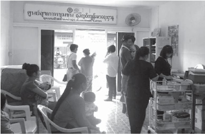
ผู้ป่วยเข้ารับบริการที่ศูนย์สุขภาพชุมชนอิสลาม

งานศึกษาการจัดการควบคุมโรคในพื้นที่ชายแดนแม่สอด ที่ผ่านมามีพบว่ามีอาสาสมัครสาธารณสุขต่างชาติและเครือข่ายภาคีในพื้นที่ มีบทบาทสำคัญต่อการเฝ้าระวังและติดตามผู้ป่วย อย่างไรก็ตาม งานศึกษาที่ผ่านมาได้เสนอข้อจำกัดในการสื่อสารข้อมูลระหว่างเครือข่าย รวมทั้งระบบการส่งต่อ/ติดตามผู้ป่วยในพื้นที่ งานศึกษาวิจัยนี้จึงได้ดำเนินการสนับสนุนศูนย์สุขภาพชุมชนเพื่อการดูแลติดตามผู้ป่วยโรค คือ