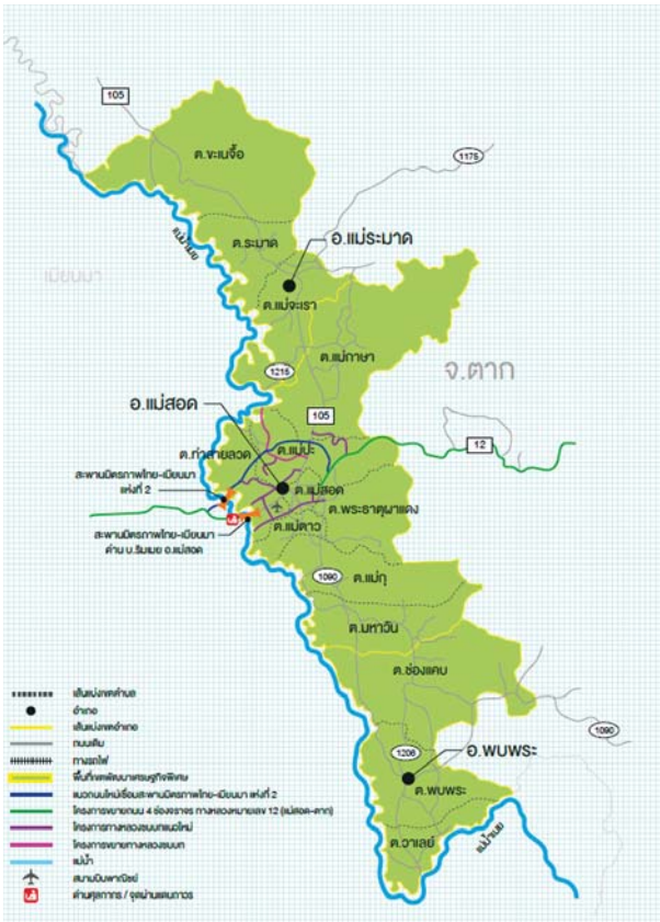
ที่มา: คู่มือการลงทุนในเขตเศรษฐกิจพิเศษ สำนักงานคณะกรรมการส่งเสริมการลงทุน

ด้านชายแดนแม่สอดเป็นจุดผ่านแดนถาวร เชื่อมต่อกับเมืองเมียวดี ประเทศเมียนมา เป็นด้านชายแดนที่มีมูลค่าการค้าระหว่างไทย-เมียนมา เป็นอันดับหนึ่ง (ไม่รวมอำเภอสังขละบุรี ซึ่งมีการนำเข้าก๊าซธรรมชาติ)