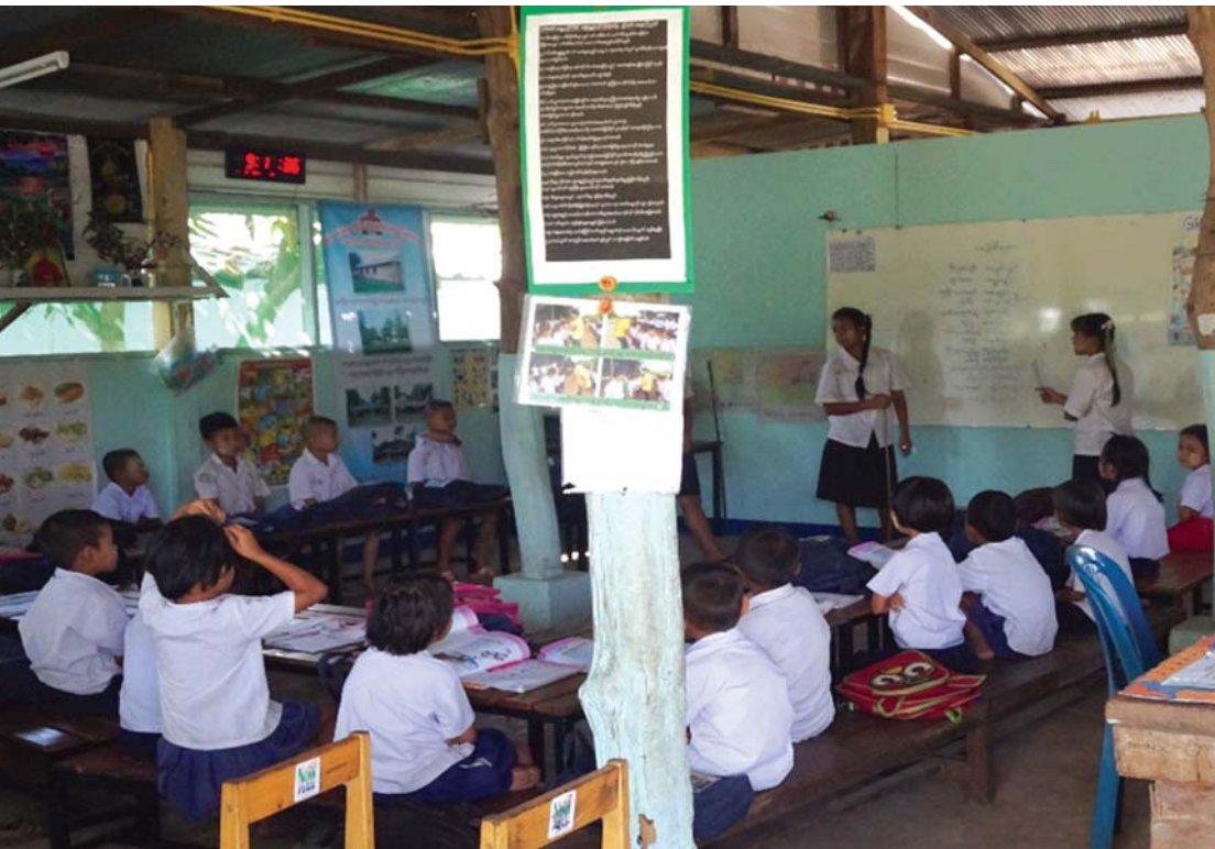
บรรยากาศห้องเรียนในศูนย์การเรียนรู้

อย่างเป็นทางการมากนัก จึงไม่ได้นำสู่บทเรียน มีได้ออกแบบสื่อการสอน และปรับหลักสูตรให้เน้นเข้าหาภูมิหลังผู้เรียนทุกกลุ่ม แต่เด็กได้เรียนรู้จากการใช้ชีวิตร่วมกันในชีวิตประจำวัน นอกจากนี้ ครูมีความเกื้อกูลต่อเด็ก มองเห็นตัวเองในเด็ก ครูส่วนใหญ่อยู่ในสถานะคนพลัดถิ่นและเป็นแรงงานข้ามชาติด้วยเช่นกัน ซึ่งนับว่าเป็นเงื่อนไขสำคัญที่บ่มครูให้มีจิตใจทุ่มเทต่อการสอน ท่ามกลางความขาดแคลน นอกจากนี้ หลายศูนย์เผยว่าได้นำวิชาสิทธิมนุษยชนศึกษาเข้าสอนเพื่อให้เกิดจิตสำนึกเคารพความเป็นมนุษย์อย่างเท่าเทียม มีใจรักประชาธิปไตย