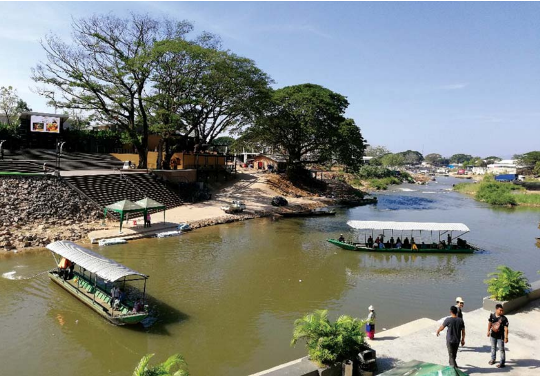
ท่าข้ามสำหรับนั่งเรือข้ามไปยังบ่อนกาสิโน

พระราชบัญญัติศุลกากร ปี พ.ศ.2560 มีผลบังคับใช้เมื่อวันที่ 13 พฤศจิกายนที่ผ่านมา ส่งผลให้เกิดการเปลี่ยนแปลงต่อการค้าชายแดน นอกระบบหลายประการ เช่น คลังสินค้าชั่วคราวได้สิ้นสภาพลง การอนุมัติทางศุลกากรเฉพาะคราวนอกเหนือจากทางอนุมัติศุลกากรแบบปกติ ซึ่งเป็นอำนาจของอธิบดีกรมศุลกากรตาม พ.ร.บ. ศุลกากร ฉบับที่ 7 มาตรา 5 ทวิ และโดยปกติอธิบดีกรมศุลกากรมอบอำนาจให้นายด่านเป็นผู้พิจารณา ไม่สามารถทำได้อีกต่อไป เนื่องจาก กฎหมายศุลกากรฉบับเดิมถูกยกเลิก เป็นต้น การเปลี่ยนแปลงเหล่านี้ส่งผลกระทบต่อผู้ค้า ผู้ประกอบการขนส่ง