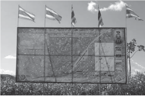
ป้ายผังแนวเขตที่ดิน ที่ถูกเพิกถอนเป็นที่ราชพัสดุ ชุมชนวังตะเคียน ตำบลท่าสายลวด อำเภอแม่สอด

ข้อค้นพบสำคัญประการหนึ่งในพื้นที่อำเภอแม่สอด คือ การเป็นพื้นที่ชายแดน ซึ่งหน่วยงานที่เกี่ยวข้องคาดว่าจะมีข้อได้เปรียบในเชิงยุทธศาสตร์นั้น แม้จะยังไม่สามารถมองเห็นได้อย่างชัดเจนว่า จะเป็นข้อได้เปรียบในแง่ของการดึงดูดให้นักลงทุนเข้ามาลงทุนทางเศรษฐกิจในพื้นที่พัฒนาเขตเศรษฐกิจพิเศษอย่างที่คาดหวังกันไว้ หากแต่ทำเลที่ตั้งของการเป็นพื้นที่ชายแดน มีส่วนช่วยเหลือเป็นอย่างมากในการบรรเทาปัญหาผลกระทบทางเศรษฐกิจและสังคมในส่วนของชาวบ้านในชุมชนวังตะเคียนที่ต้องสูญเสียที่ดินทำการเกษตรไป เมื่อพวกเขายังมีโอกาสที่จะแสวงหาแนวทางประกอบอาชีพที่อยู่บนพื้นฐานความสัมพันธ์ทางเศรษฐกิจและสังคมกับเพื่อนบ้านและญาติพี่น้องข้ามพรมแดน เช่น การติดต่อค้าขาย และการขนส่งสินค้าข้ามแดน นอกจากนี้ ในแง่ความสัมพันธ์ทางสังคมแล้ว การที่ชาวบ้านในชุมชนวังตะเคียนบางส่วนมีสถานะเป็นคนไทยพลัดถิ่น ซึ่งพวกเขายังคงมีญาติพี่น้องที่อาศัยอยู่ในจังหวัดเมียวดี ในฝั่งตรงข้ามพรมแดน เขตประเทศเมียนมา จึงทำให้ยังมีเครือข่ายความสัมพันธ์ทางเครือญาติและทางสังคม ที่สามารถให้ความร่วมมือและช่วยเหลือในการแสวงหาแนวทางในการทำมาค้าขาย และการลงทุนทำธุรกิจต่าง ๆ ข้ามพรมแดนได้